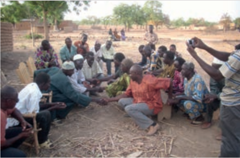
3 Alles war zur Zufriedenheit der Brautfamilie. Man beglückwünscht sich und segnet das neue Bündnis.

des Geldes und der dazugehörigen Güter kommt. Geplant gestreute Witze zwischen den beiden Verwandtschaftsgruppen lockern die Situation auf und testen die Reaktion der anderen Seite [siehe »Scherzbeziehungen«, Seite 97].