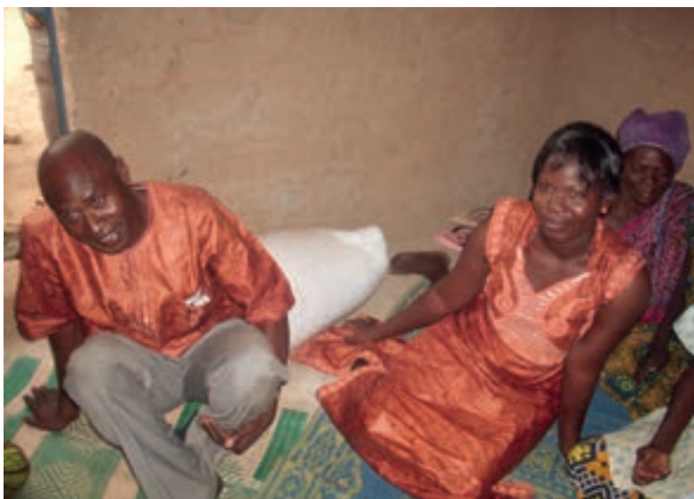
☒ Das erleichterte Brautpaar vor dem Salzsack, der Teil des Brautpreises ist.

Das Zusammenkommen und Bezeugen der Rechtmäßigkeit der bevorstehenden Eheschließung ist wichtiger als die beteiligten Güter selbst. Als sichtbares Zeichen dafür, dass ein Ereignis stattgefunden hat, sind sie jedoch unverzichtbar. Die Übergabe des Brautpreises ist nur ein kurzer Moment, der durch Geld und Güter verkörpert wird, aber auf einen langen Prozess mit offenem Ausgang verweist. Während wir Verträge unterzeichnen, deren Unterschrift lange nachwirkt, isst man dort von der Suppe, die mit dem Salz des Brautpreises gewürzt wurde. Durch diese Einverleibung haben die Beteiligten die Information der Heirat erhalten und gleichzeitig ihr Einverständnis bekundet. Dieser so geschlossene Pakt soll das Bündnis zwischen den beiden Familien festigen und deren Bereitschaft zum Ausdruck bringen, dem jungen Ehepaar bei eventuellen Problemen beizustehen. Letzte-