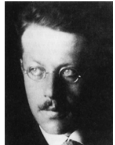
Franz Rosenzweig (1886–1929) war Leiter der Frankfurter Jüdischen Volkshochschule, als er 1922 von der Israelitischen Kultusgemeinde für den ersten Lehrauftrag für jüdische Religionswissenschaft vorgeschlagen wurde. Wegen einer schweren Krankheit konnte er die Vorlesungen nicht halten.