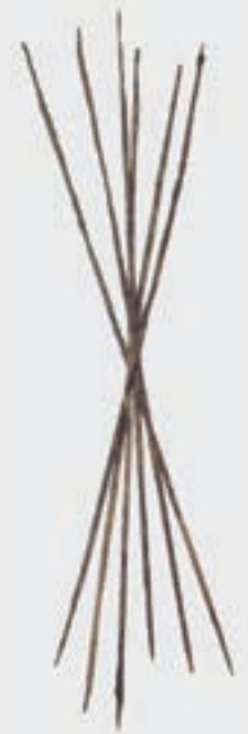
Obolos heißt übersetzt Bratspieß und sechs Obolusse sind eine Drachme wert. Dieses Bratspießbündel wurde im Heiligtum der Hera von Argos gefunden.

Die Vermutung, dass Bratspieße als Zahlungsmittel dienten, basiert auf der Angabe eines etymologischen Lexikons aus dem 12. Jahrhundert n. Chr.: Demzufolge soll König Pheidon von Argos (Peloponnes) die als Zahlungsmittel umlaufenden Obeloi eingezogen, im Tempel der Hera geweiht und durch Münzen ersetzt haben. Obwohl es dafür archäologische Hinweise gibt, bleibt ein chronologisches Hindernis, denn Pheidon datiert ins 8. oder maximal ins 7. Jahrhundert v. Chr., die ersten silbernen Drachmenmünzen kamen aber erst später, im 6. Jahrhundert v. Chr., auf. Sollten die Speiße tatsächlich einmal in Griechenland als Geld gedient haben, waren sie wohl Lokalgeld und ihr Wert entsprang kaum der Funktion als Kochgerät, sondern dem Gehalt an Eisen, als seien sie Barren.