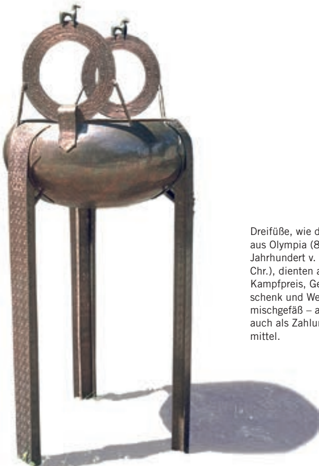
DreifüÙe, wie dieser aus Olympia (8. Jahrhundert v. Chr.), dienten als Kampfpreis, Geschenk und Weinmischgefäß – aber auch als Zahlungsmittel.

Münzen waren nicht das erste Geld. In der griechischen Frühgeschichte (17. bis 6. Jahrhundert v. Chr.) dienten Rinder, Frauen, Dreifüße, Gold- und Silberschrott, Bratspieße, Kessel und kostbare Gewänder als Zahlungsmittel. Charakteristisch für frühe Geldformen ist ihre funktionale Vielfalt: Mit Kesseln und Dreifüßen konnte man bezahlen, sie dienten aber auch als Preise für Wettkämpfe und Weihegeschenke oder eben als Weinmischgefäß oder Kochtopf für Badewasser. Wie die Wirtschaft unter solchen Bedingungen funktionierte, hing stark von der Gesellschaftsform und ihren Handelsbeziehungen ab.