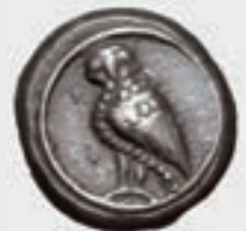
Eine Athener Doppeldrachme aus dem sechsten Jahrhundert. Während die ersten Münzen in Lydien aus Elektron gefertigt wurden, war die Leitwährung in Griechenland aus Silber.

den, beruhte die Erfindung der Münze, die auf die normierten Stücke nur noch ein Bild prägte.