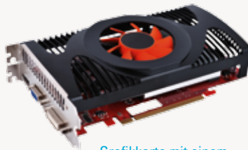
Grafikkarte mit einem Ventilator zur Kühlung.