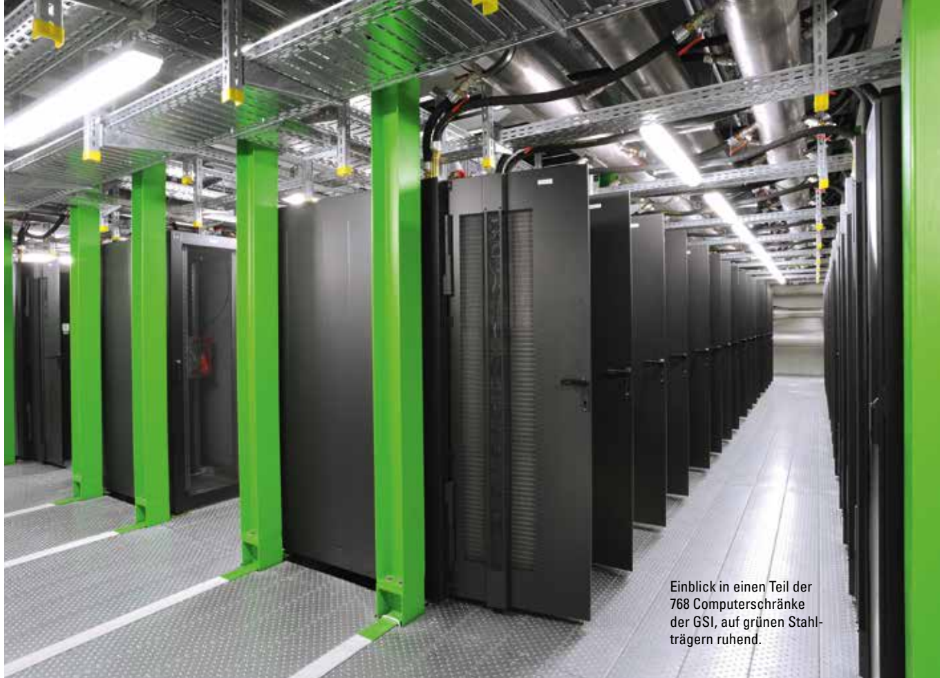
Einblick in einen Teil der 768 Computerschränke der GSI, auf grünen Stahlträgern ruhend.